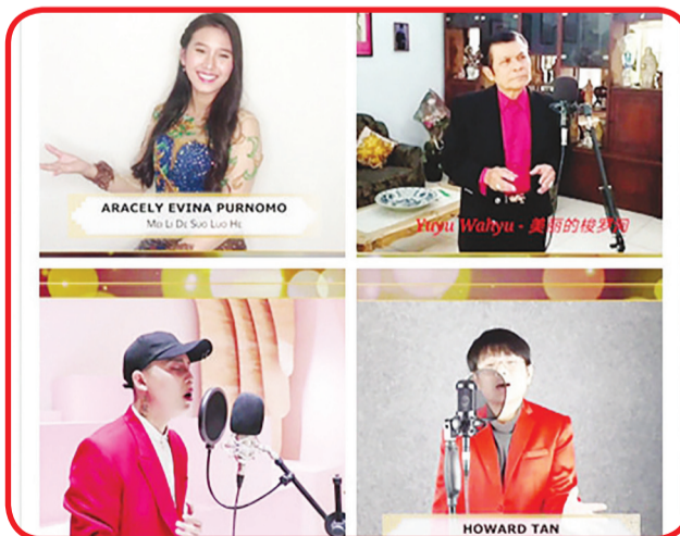
Penampilan peserta Mandarin Virtual Karaoke Competition Grand Final.