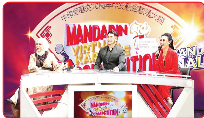
Dewan juri Mandarin Virtual Karaoke Competition.

Setelah melalui babak penyisihan dan semifinal, 8 orang