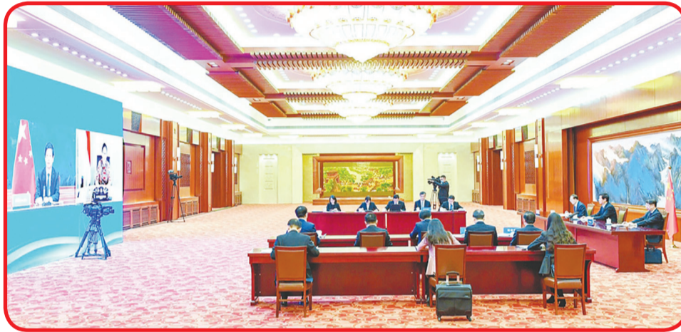
Suasana audiensi online antara Chairman of the Standing Committee of the National People's Congress Li Zhanshu dan Ketua MPR RI Puan Maharani di Great Hall of the People.

DPR RI, kata Puan Maharani, bersedia memperkuat interaksi dan kerjasama dengan Kongres Rakyat Nasional Tiongkok demi memberikan kontribusi pada perkembangan hubungan bilateral yang mendalam. • idn/din