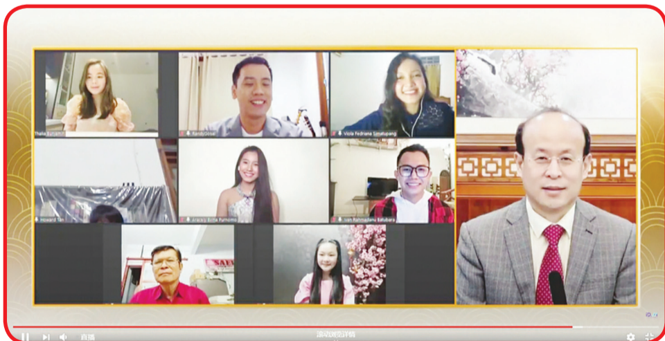
Suasana Mandarin Virtual Karaoke Competition Grand Final.