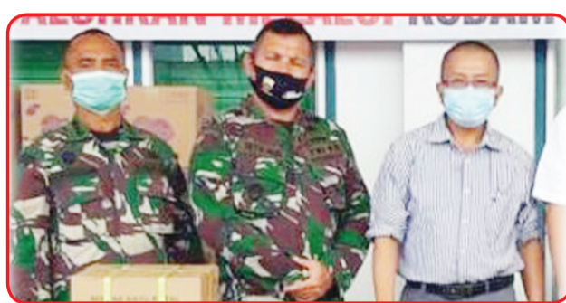
Letkol KAV Setia Budi menyampaikan pidato.

MEDAN (IM) - Beberapa hari lalu, Kota Medan provinsi Sumatera Utara dilanda hujan lebat yang menimbulkan banjir besar di sejumlah daerah. Hal ini mengakibatkan ribuan rumah terendam dan ribuan keluarga terdampak bencana hingga menyulitkan kehidupan mereka.