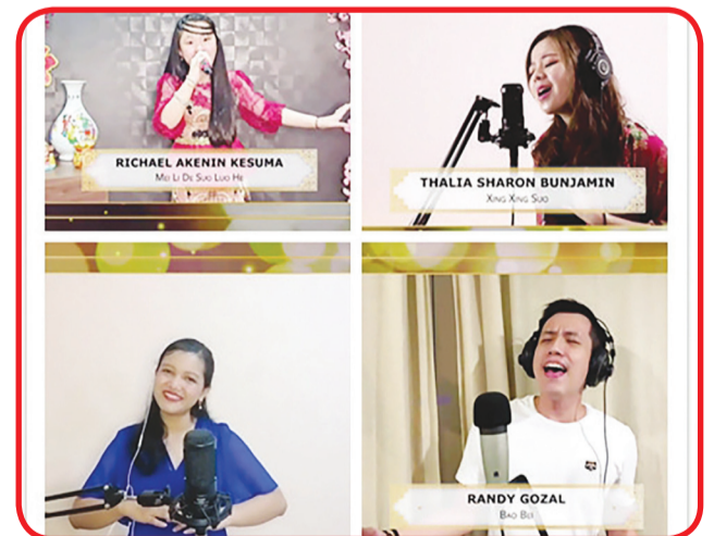
Penampilan peserta Mandarin Virtual Karaoke Competition Grand Final.